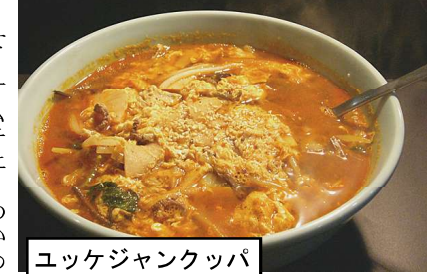
ユッケジャンクッパ

せ・サムチエ・わかめの酢の物・焼きのり・センマイほか 御飯もの：ピピムパ・ユッケビビムパ・ユッケジャンクッパほか スープ：ユッケジャン・鳥・カルビ・玉子・野菜・ワカメ めん類：ラーメン・ユッケジャンラーメン・カルビラーメンほか 飲み物：ビール・日本酒・レモンハイ・ジュース・サイダーほか つけ物：キムチ・オイキムチ・ナムル キムチさん元気が出ました。ありがとうございます。最近みつけ隊の酒量が落ちていきます。でもこれからもがんばります。