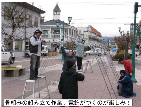
骨組みの組み立て作業。電飾がつくのが楽しみ!

浅間山や八ヶ岳の冠雪に合わせるかのように、各地のイルミネーションが話題に上る季節となりました。 中込の街も、駅前グリーンモールや洞庭春さんのせせらぎ側、料飲街の街灯と、きらびやかな電飾が飾り付けられクリスマススムードたっぷり演出でお客様を歓迎しております。 そして毎年お馴染みの光景に今年から仲間入りすることとなったのが、 もつてえねえ市会場でお馴染み、サングリモ中込南側の中央グリーンモール広場で組み立てが始まった、イルミネーションの回廊(トンネル)です。 光の回廊が一躍話題を集め、ウインターイルミネーションの人気スポーツトとなつて、三重県のナガシマリゾート「なばな」にヒントを得て、中込商店街も歩行者専用道路という特性を活かした、歩いて通れるイルミネーション計画いたしました。 11月25日現在で予定している電球の数はなんと、4万球。 慌てて電気設備屋さんにも配線工事もお願ひするぐらいの数量です。 骨組みを組み立て始め、実際に通りかかった中込小学校の女の子たちも、「中を歩きたい!」と興奮を隠しきれず叫び声を挙げていました。 「どうせ作るなら長いトンネルを」ということで、当初の予定よりほとんど全長が伸び、最終的には25メートルでの完成となりそうです。 本紙が28日に新聞折込で皆様のお手元に届くころには、もうイルミネーションが光を放っているかもしれません。 使用するイルミネーションの総延長は、ざっと計算しても2キロメートルを超え、トンネルの周囲に約80本というすごい数のイルミネーションが張り巡らされる華やかなものとなり、骨組みへの取り付け作業は、役員の総動員が必至です。 さらに先の話となりませんが、来年は地下道の入り口までつなげてしまおう、という壮大なプランも浮かび上がっています。