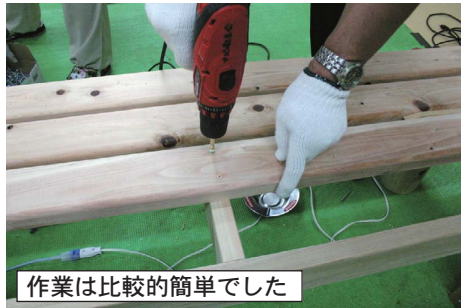
作業は比較的簡単でした

中込商店街のお得情報・お役立ち情報をお届けします。 今回は7月30日(土)に新聞折込に入ります。 本紙ネット版も商店会サイトに掲載しています。