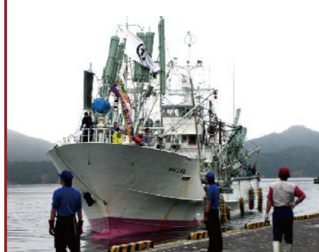
さんま大型船第十五笠丸 岩手県内に2隻しかない大型船のうちの1隻。169トン 15～16人乗り。震災の時は浜にあって奇跡的に難を逃れた。

三陸は世界三大漁場のひとつ カナダ大西洋沿岸、ヨーロッパ北海、そして三陸沿岸が世界の三大漁場。豊かさに恵まれたこの地にはリアス式海岸のダイナミックな景観が続きます。 毎日、東京・大阪市場をはじめ全国市場に出荷。帆立、さんまを中心とする三陸の魚介類（帆立、さんま、かき、鰹、鮭、いか、わかめなど）を供給しつづけています。 (鎌田水産(株)のホームページより)