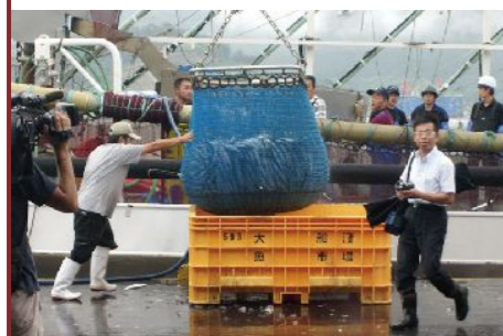
8月下旬の初水揚げのようす。大勢の取材陣が来て地元のトップニュースだった。

三陸は世界三大漁場のひとつ カナダ大西洋沿岸、ヨーロッパ北海、そして三陸沿岸が世界の三大漁場。豊かさに恵まれたこの地にはリアス式海岸のダイナミックな景観が続きます。 毎日、東京・大阪市場をはじめ全国市場に出荷。帆立、さんまを中心とする三陸の魚介類（帆立、さんま、かき、鰹、鮭、いか、わかめなど）を供給しつづけています。 (鎌田水産(株)のホームページより)