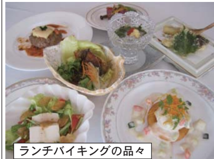
ランチバイキングの品々

中込うまいもんみつけ隊(第114回) 佐久グランドホテル 花火大会も無事に終わって一安心している隊員達。夏の疲れも出てきているようでちょっと贅沢な気分を味わいたいとひそかに思っていた隊員の一人。「ねえねえ。座っていても席まで運んで来てくれるいいバイキングがあるんだけど行ってみたいな? 今月からメニューが代わって秋を感じられるんだよ」とそんな話を聞いた隊員は顔がにやけてしまっているのにも気付かず「何処に行けばいいの?」と催促をしています。 「そんなリッチなことをしてくれるのは佐久グランドホテルさんでしょ」と言うことでさつそく向かっています。席に案内されるなり、まずは寒くても何でも「生下さい」と頼んでいる隊員。でもすぐに「デイナーオーダーバイキングでお願いします」と食べる気満々。運ばれてくるのを楽しみにしています。 ビールと共にどんな料理を運んで来てくれるか。まずはじめに運ばれてきたのが秋を感じさせてくれる秋のオードブル。そのお皿の中は秋一色。きのこおろし・サザエウニ焼・小さな焼き芋と秋色が楽しめる。豆イカわさびはビールにぴったり。栗は穂栗風になっていて食べると食感がたまらない。小さい焼き芋は見た目も可愛く味も美味しい。女性にうける一品です。 そうそう。今回のメニューは前述のお皿をはじめ、ブッシュと気まぐれサラダ・お刺身が貝の造り三種・スズキとホタテのナージュ・サーモン塩麹とサ ンマわた焼・海鮮湯葉巻のカニ入りあんかけ白菜巻・仔牛のカツレツミラノ風・おまかせ寿司・巨峰のロールケーキバナラアイス添えて・ライスパンと内容も豪華。気分はセレクト感覚。 どの料理も美味しいし座っているのにどんどん運んで来てくれます。気に入った料理は再度頼めるんですから十分に楽しめます。 隊員たちは気に入ったものを一人は気まぐれサラダだったり、秋のオードブルだったりそれぞれでしたが再 オーダーし、それに合わせてワインなんか飲んでるから気分がいいんじゃないかな。 このバイキングは金・土・日・祝限定なんです。予約さえして頂ければ平日も対応してくれるんです。平日の月曜から金曜はランチのオーダーバイキングもあって、このメニューも今月からリニューアルして、本日のスープ・本日の小鉢・豆腐のゴマソース・サンマ竜田の和風おろしサラダ・砂肝ときのこの黒こしょう炒め・美幌ポテト野菜クリーム・チーズハンバーグポロネーゼ・チーフスハンバーグ・ポロネーゼ・めぐちの天ぷら・ライスパンとこれもある食べられて嬉しい限りですよ。それにランチはコーヒーもついて980円なんです。さらに本日のデザート1品サービス。 今日はデイナーだったけどランチも来てみようと思う隊員達でした。佐久グランドホテルさん美味しいお料理をありがとうございます。