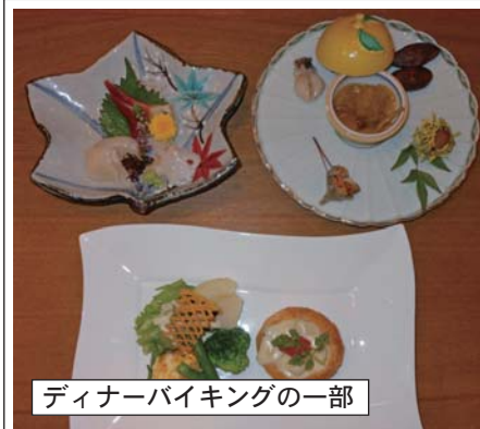
ディナーバイキングの一部