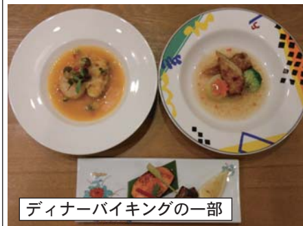
ディナーバイキングの一部