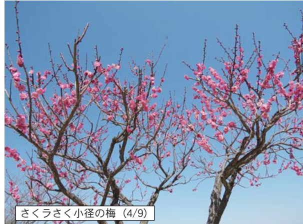
さくらさく小径の梅 (4/9)

中込周辺花だより 長野県内も伊那谷や松本で桜の開花が報じられています。さて当地の花見はいつ頃が良いのでしょうか？ 見ごろは4月20日頃？ 昨年は非常に早く桜が開花しましたが、今年は平年並みではないでしょうか。 中込会館の桜 この桜は会館を背にした陽だまりに立っていますので中込では早く咲くことで良く知られています。