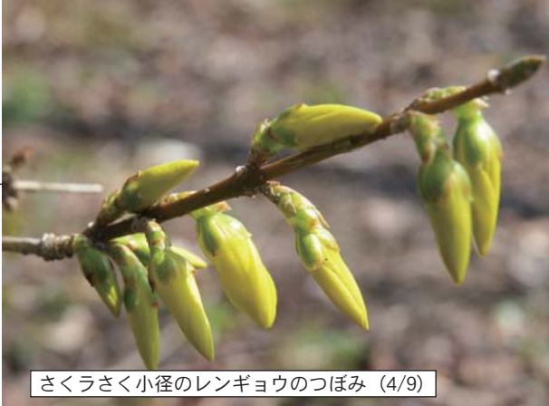
さくらさく小径のレンギョウのつぼみ (4/9)

まだつぼみですが、よく見るとピンクの花が顔を出しています。あと1〜2日で開花しそうです。 成田公園の桜 大きな木が多く、最盛期には野沢橋や佐久大橋側から見ても見事です。公園の北西の角に毎年一番早く咲く桜の木があります。やはり中込会館の桜と同じくらいにちよつと色付いています。 さくらさく小径 桜はまだつぼみですが梅がそろそろ見ごろを迎えています。つぼみもたくさんありますから、まだ一週間以上楽しめます。スイセンは4月9日にはまだ開いていなかったのですが、本紙がお手元に届くころには咲き始めていることでしょう。