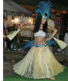
HITIMAHAN Aヒミアハナ(タヒチアンダンスサークル)

恒例かき氷・わたあめ 特価販売(5日) コオロギさん似顔絵会 ・料金：1人1000円 ・所要時間：約8分 午後1時～3時 4時～6時 7時～9時 似顔絵ご希望の方は事前予約を受け付けています。7月2日午前10時～午後4時。商店会625714で。 シルバー人材センター 刃物研ぎ：10時～15時・ほんわ館 中央グリーンモール ゆめ佐久カードお買い物券交換会 通常500円で使える満点カードが700円のお買い物券に。午前11時～午後2時。お一人様10枚まで。 会場：サングリモ中込 生ビール：おつまみ付き500円・午後2時～午後3時30分 ダンスクラブKDC ダンスクラブRoio Link(ロロリンク)