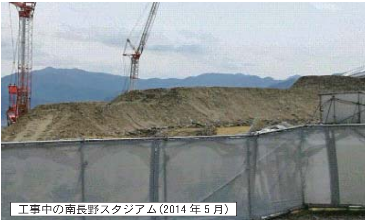
工事中の南長野スタジアム(2014年5月)

ない会場に戸惑い苦戦しましたが、準備作業を進め、長野からのサポーターを迎えました。AC長野vs.福島ユナイテッド戦には4千人を超えるサポーターが駆けつけました。AC長野は1-0で福島を下し、J3開幕戦を勝利で飾りました。 佐久開幕戦 佐久での開幕戦を前にパルサポ千曲川佐久支部メンバーらによる佐久陸上清掃が行われ、たくさんの方のサポートがボラン