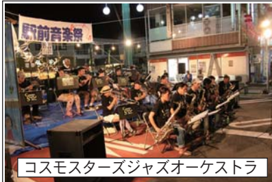
コスモスターズジャズオーケストラ

地元中込の保育園・幼稚園の皆さんが描いてくれたたくさんのお絵かきを展示します。 中込中学校吹奏楽部 演奏会：午後4時 ダンスクラブKDC発表会：(午後5時・6時) コスモスターズジャズオーケストラ：真夏のジャズライブ(午後7時・8時30分)