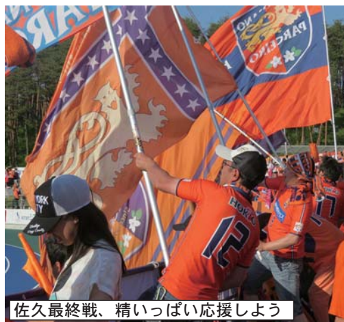
佐久最終戦、精いっぱい応援しよう