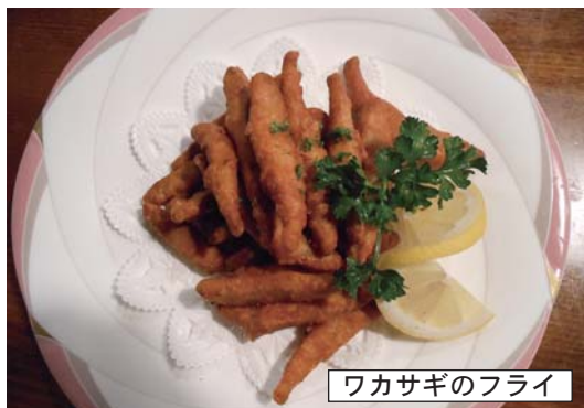
ワカサギのフライ

「そう言えばティーボーンさんでそんな感じのメニューがあったよ」と、もう隊員達の足はお店のある方に向かっています。思いたつと行動はめっちゃめっちゃ早いのが隊員達。お店に着くとやはり「ビールください」と席にもつかずに頼んでいるからすごい。でも、席に着くとまず