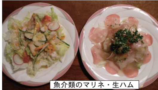
魚介類のマリネ・生ハム

運動会のシーズンになってきた今日この頃ですが、陽気も朝と晩は肌寒い感じがしますが、昼間はお天気になるとまだ暑いかな?と思うような日差しだったりしています。体調を壊す方が多いように思います。隊員たちも少しバテ気味になってきていて、ここで少し体力を付けようとお肉を食べたいなとそんな話をしていると「ガッツリス