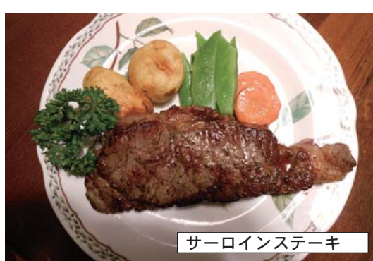
サーロインステーキ

ばれてきました。塩味がちょうどいい生ハムを食べながらビールを飲んで嬉しそう。魚介類のマリネは色々な魚が入っていてどんな魚が食べていいでしょうか。お皿の空くのが早い。そうしているとワカサギのフライがいい匂いと共に運ばれてきました。熱いけどカリカリで美味しい。魚が柔らかい」とこれも瞬間になくなってしまいました。さあここから本番。お目当てのお肉が運ばれてき