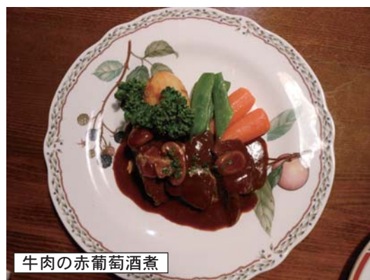
牛肉の赤葡萄酒煮

「一品料理も平均が500円なのでその中から何品か選んでいます。選んだのは、魚介類のマリネ・生ハム・ワカサギのフライ」とこれはどれも500円なので嬉しいですね。早速運ばれてきたビールを飲み始める隊員達。美味しそうに飲んでいきます。飲んだ後は何かか声が出るのは何でしょうかね。そうしている、生ハム・魚介類のマリネが運