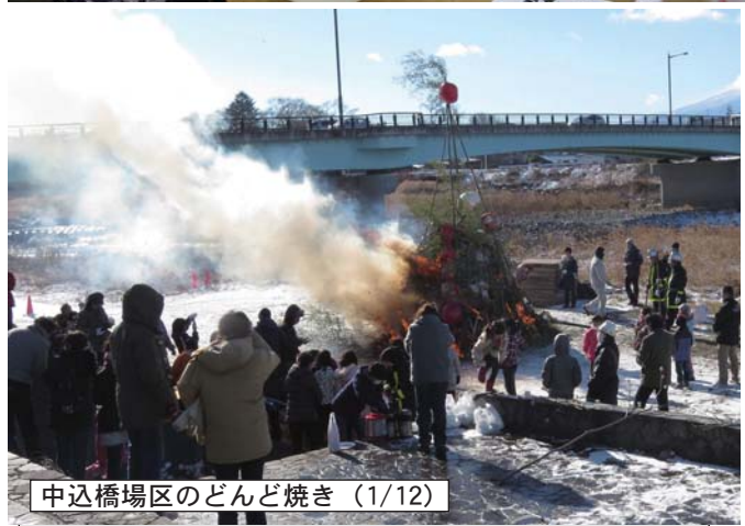
中込橋場区のだんど焼き (1/12)