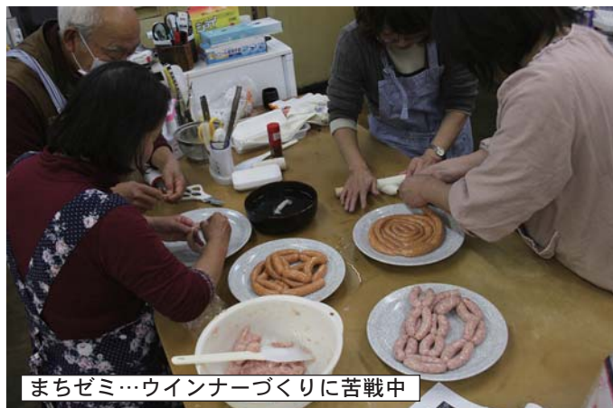
まちゼミ…ウインナーづくりに苦戦中

中込商店街のお得情報・お役立ち情報をお届けします。 次回は1/25(日)に「まちゼミ」を特集します。 本紙ネット版も商店会サイトに掲載しています。