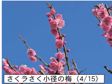
さくらさく小径の梅 (4/15)

次回の もてな祭市 会場：サングリモ中込 5/30 夜7時～8時 出品受付 出品料は1品10円です 出品数制限はありません 6/6 11時～1時 販売 1時30分～2時 出品者清算