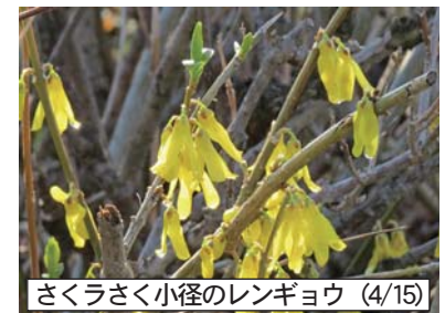
さくらさく小径のレンギョウ (4/15)

■ 閉店のお知らせ 創業以来みなさまのご厚情を頂き営業してまいりましたが、このたび諸般の事情により閉店いたしました。 大変永い間ご愛顧いただきましたみなさまに心より感謝申し上げます。 梅月堂