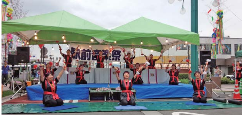
「やまぼうし」の皆さまによる銭太鼓演奏

7月4日(土)に開催した中込七夕まつりは、時折雨がパラつく天候でしたが強く降ることもなく無事に終了しました。 小学生の皆さんが書いた「七夕人形」や、保育園・幼稚園のみなさんの「お絵かき展示」には、ご家族と思われる方たちが作品を探したり、また多くのお客様が願い事を読んで「最近の子供たちは『世界平和』など願い事のレベルが高いな」と感心していらっしゃいました。