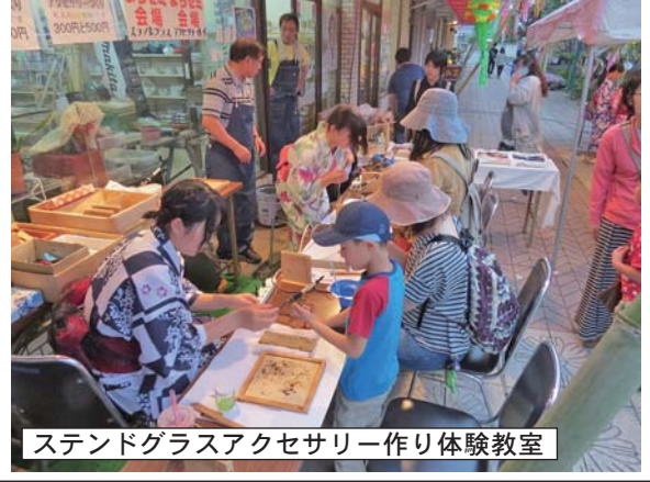
スタンドグラスアクセサリー作り体験教室

丸正商店前では「まちの歌の発表があり、盛大な歓声があがっていました。 銀座グリーンモールでも地元ミュージシャンによるフォークソングのアカousticライブ弾き語りライブがあったほか、アトリエねこさんのポスターペインティングのブースでは、子供から大人まで腕や頬に動物の絵柄のペイントをしたり、人気キャラクター「ジバンヤン」のペイントをして楽しんでいました。