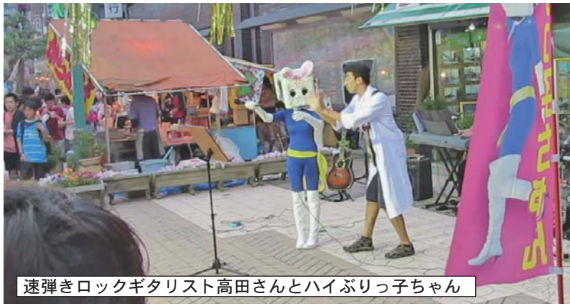
速弾きロックギタリスト高田さんとハイぶりっ子ちゃん

音楽イベント目押しし 駅前グリーンモールのステージでは、中込中学校吹奏楽部の演奏「やまぼうし」の皆さまによる