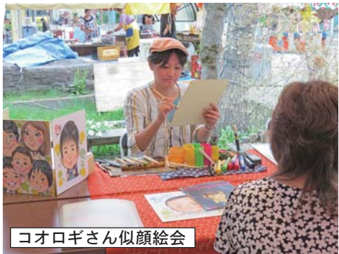
コオロギさん似顔絵会

(2面よりつづき) お断りする事になってしまいました。来年は2日間できないかと、コオロギさんと相談しております。 内山キラキラプロジェクト の皆さんによる「内山ブース」では「エコ缶ドル」づくりが行われ、火を入れるととても可愛い、きれいなミニランタンができていました。 また七夕においでいただいたお客様に、短冊に願い事を書いて飾っていただき、その総枚数を当てるクイズには大勢の皆さまにご応募いただきました。今年の「内山ブース」短冊は770枚でした！当選者