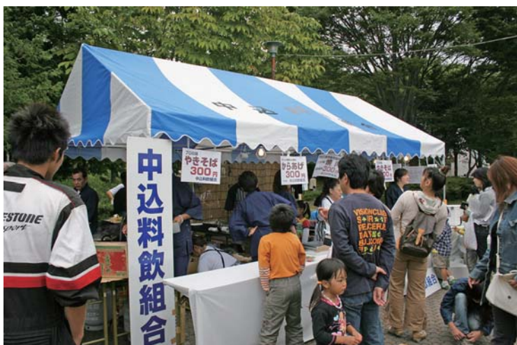
大人気の中込料飲組合のテント

10月3日(土)10時~17時 10月4日(日)9時~16時 毎年たくさんのお客様に 楽しんでいただいております。 「ぞっこん! きく市」が 園長野牧場を会場として 開催されます。