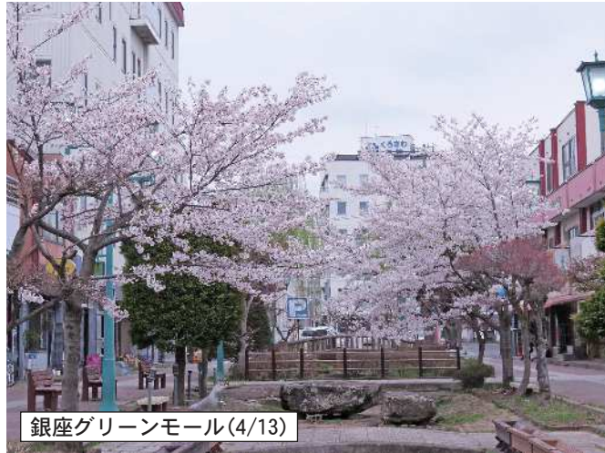
銀座グリーンモール(4/13)

中込商店街のお得情報・お役立ち情報をお届けします。 次回は4/30(土)に新聞折込に入ります。 本紙ネット版も商店会サイトに掲載しています。