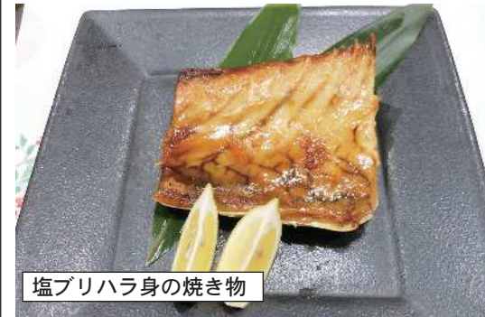
塩ブリハラ身の焼き物

藤生花店さんの近くに移動した吉粹さんに伺うと、明るい店内で店主さんがよく見えて温かい雰囲気です。家に帰ってきたような気持ちになります。店内に入ると恒例のように生かださいと隊員たちは変わらぬ健在です。席に着くと、店主さんが毎日その日仕入れたいい物をおまかせでコースのようにして提供してくれ