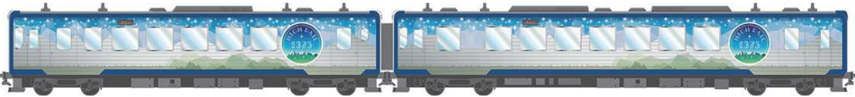
HIGH RAIL 1375(ハイレールイチサンナゴ)

中込・岩村田・佐久平・小諸と、 各駅停車ではなく臨時快速列 車として運転されます。 指定席券が必要 オリジナルブランドやスイー ツが楽しめるビュープラザの旅 行企画(2面)もあります。 乗るだけでしたら通常の運賃 と指定席券の料金です。中込 小淵沢なら1320円+指定 席券820円で2140円、こ もは1070円です。 インテリアもなかなか豪華 列車名にある1375はJ Rの最高地点の標高。「天空に いちばん近い列車」をコンセプト (2面につづく)