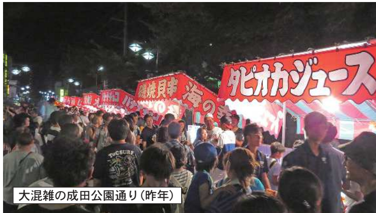
大混雑の成田公園通り(昨年)

責任でマナーを守ってご利用ください。 あくまでも自己責任を負いません。 盗難などの責任を負いません。 主催者も駐車場の所有者も事故の責任を負いません。