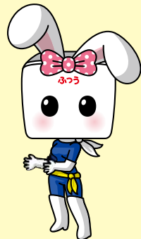
中込商店会協同組合特命宣伝部長ハイぶりっ子ちゃん

商品を守るためのイベントではありません。何か買わないと気まずいということはありませんので、お気軽にご参加ください。用事がないと入りにくいと思っていたお店にもぜひお出かけください。