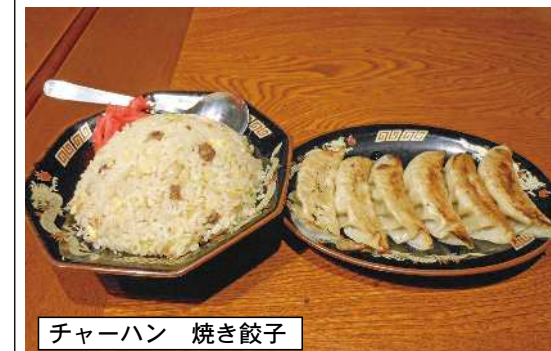
チャーハン 焼き餃子

この商品は店主さんもおすすめの物なので隊員たちも頼まないわけがないです。やきとりに注文すると店員さんから「注文を受けてから焼きますのでお時間頂きます」と説明があり、待ち遠しさと楽しみでいいですね。早速生ビールが運ばれてきて、まずは飲んでからおいしい音を鳴らしながら美味しそうに飲んでいきます。隊員たちは寒くても生を飲まないし始まらないようです。そこに