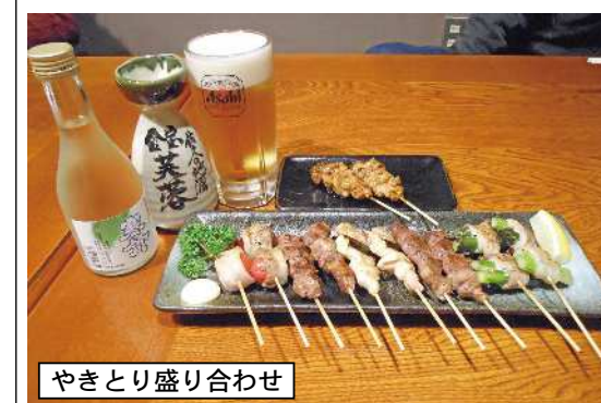
やきとり盛り合わせ

11月に入り天気も不安定な日が多く段々と寒い日が多くなってきたように思います。商店会ではそろそろ年末の準備になつてきています。今年もマルシェを開催するので準備をしたり年末に向けての用意など忙しい毎日を送っているのが隊員たちは少しお疲れ気味です。