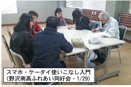
スマホ・ケータイ使いこなし入門 (野沢南高ふれあい同好会・1/29)

中込商店街のお得情報・お役立ち情報をお届けします。 次回は2/17㊤に新聞折り込みに入ります。 本紙ネット版も商店会サイトに掲載しています。