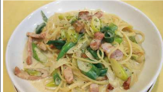
厚切りベーコンと下仁田ネギのカルボナーラ

お正月気分でしたら、あつという間に1月が終わってしまいました。 朝はマイナス10度なんて冷え込みも何日もありましたから体にこたえます。雪は少なくてふだんの生活は楽ですが、これから上雪の季節になるので油断できませんね。 商店会ではまちゼミの真つ最中で、来年度事業に向けた準備もあつて隊員たちも忙しそうです。 そこでいつものように美味しい物を食べて体力