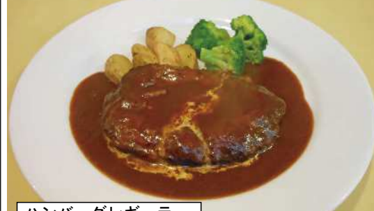
ハンバーグレギュラー