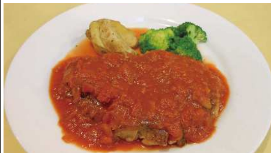
若鳥のトマトソース