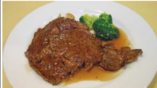
特選牛サーロインステーキ生姜焼き