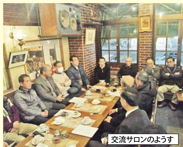
交流サロンのようす