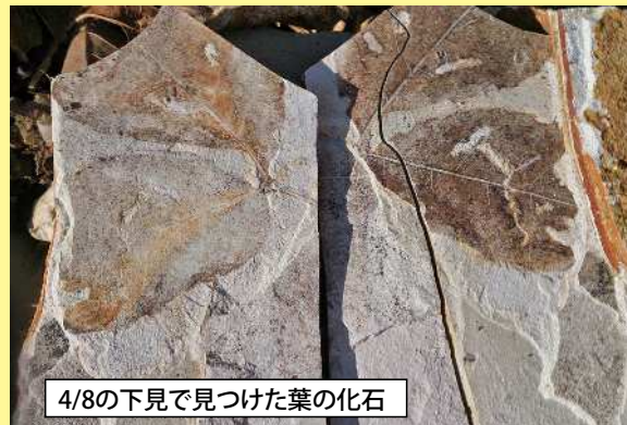
4/8の下見で見つけた葉の化石