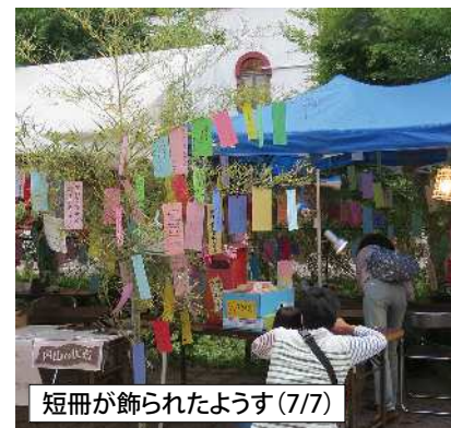
短冊が飾られたようす(7/7)

願い事の短冊を書いてくださ ったみなさん、クイズにご応募くださ ったみなさん、今年も本当にありが とうございました。これをきっかけ に、これからも、内山コスモス街道 に、足を運んでくださいね。