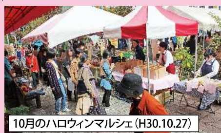
10月のハロウィンマルシェ(H30.10.27)

ラシにも出店者・商品の紹介を載せます。お問合せ等はオーガニックヘアサロンCheller(チェリエ)へどうぞ。 ☎ 0267-78-5004