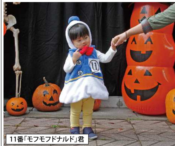
11番「モフモフナルド」君

参加されたすべての皆様の写真を掲載したいのですが、スペースの都合で得票の多い方の写真のみ掲載いたします。