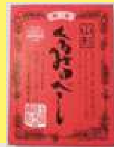
くるみゆべし 540円 6個 くるみがたっぷり 入った、程よい甘さ の昔から愛されてき た郷土菓子です。