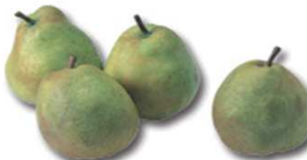
ラ・フランス (予定) 秋に味わう「フルーツの女王」 果物王国の旬「ラ・フランス」 ぜひこの機会に!