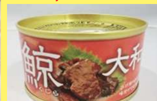
鯨 大和煮 700円 235g