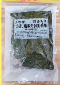
湯通し塩蔵わかめ 500円 500g