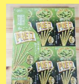
すんだブリッツ 850円 147g