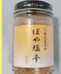
ほや塩辛 1,080円 140g