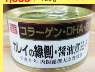
カレイの縁側しょう油煮込み 500円 170g