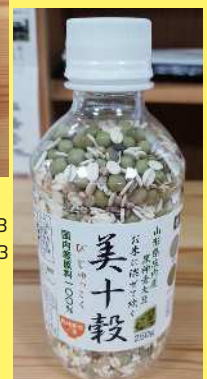
美十穀 800円 270g 出し醤油のもと 480円 10g