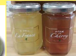
さくらんぼジャム 600円 145g ラフランスジャム 600円 145g

他にもいろいろ取り揃えております みそ焼まんじゅう…180g 300円 黒まんじゅう…180g 300円 オランダせんべい…2枚×10 250円 トマトあめ…100g 400円 生姜あめ…100g 400円 最上小石…6個入 900円 からし漬…120g 380円 ぜんご漬…110g 380円 しなべきゅうり…110g 380円 いぶしたくあん…250g 480円 くるま麩…80g 400円 三陸産塩蔵わかめ…120g 350円 三陸産おつまみ板昆布…27g 380円 焼海苔 寿司用はだし10枚 400円 ほや酢明 箱入…12g 400円 売り切れの際はご容赦ください。 価格はすべて税込みです。