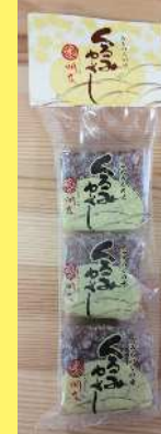
角折くるみゆべし 420円 3個 角折ごまゆべし 420円 3個