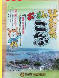
けせんぬまの おつまみこんぶ 150円 11g