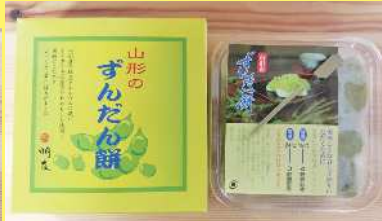
ずんだ餅 800円 250g