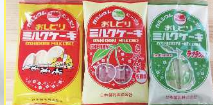
ミルクケーキ 230円 9本 牛乳を母として作り上げたやさしい ミルク菓子です。カルシウムが豊富 に含まれ「たべる牛乳」としてお勧 めします。 ミルクケーキ・フランス 230円 8本 ミルクケーキ さくらんぼ 230円 8本