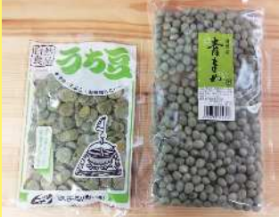
うち豆 240円 100g 山形産青まめ 380円 250g