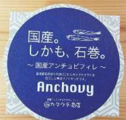
石巻アンチョビフィレ 380円 50g