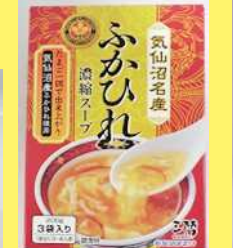
ふかひれ濃縮スープ 350円 200g 1,080円箱入 200g×3