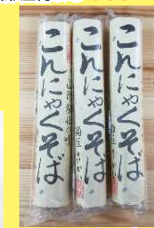
こんにやくそば 270円 150g