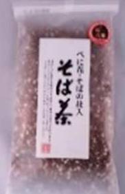
そば茶 480円 200g