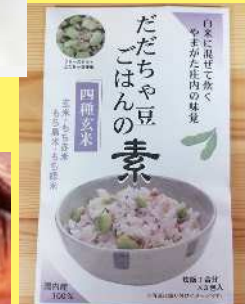
だだちゃ豆ごはんの素 600円 四種玄米 16g×3 600円 六種雑穀 16g×3 山形県庄内地方の だだ茶豆に厳選し た国内産雑穀を加 え豊かな風味と彩 りをお楽しみいた だけます。