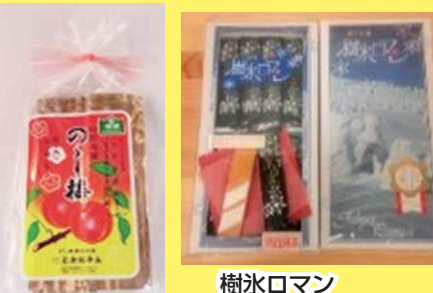
樹氷ロマン 750円 16枚入 山形土産の定番商品です。 焼き菓子です。