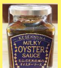
オイスターソース 1,000円 160g