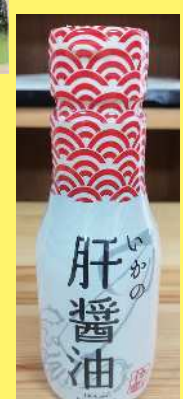
いかの肝醤油 700円 200ml