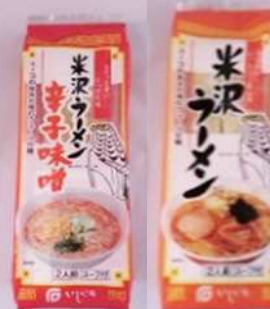
米沢ラーメン醤油味 300円 210g 米沢ラーメン辛子味噌 300円 250g