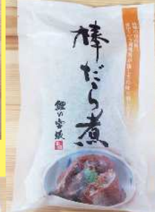
棒だら煮 650円 150g