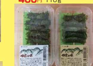
しそ巻き くるみ味 150円 しそ巻き 白ごま味 150円