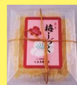
梅しづく 580円 160g