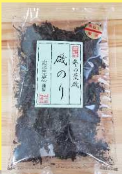
磯のり 580円 18g