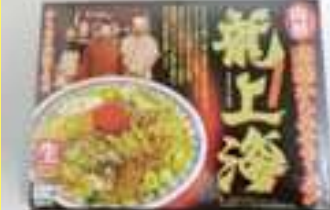
箱入赤湯ラーメン 龍上海 1,200円 140g×3