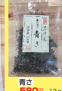
青さ 580円 13g