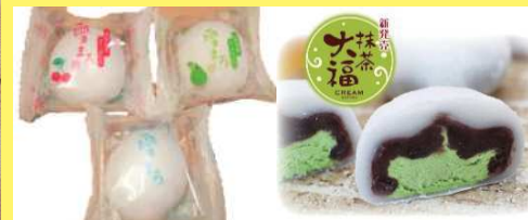
雪まる…秘伝豆…150円 雪まる…さくらんぼ…150円 雪まる…ラフランス…150円 生クリーム大福…150円 抹茶クリーム大福…150円 プリン大福…150円 地元で愛されている山形の老舗が作った 人気商品です。