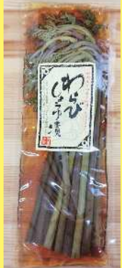
わらびしょうゆ漬 400円 100g 山うどしょうゆ漬 400円 110g