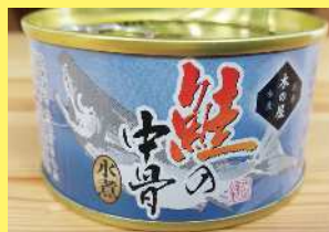
鮭の中骨水煮 250円 235g

1/19 (土)・20 (日) 10:00 ~ 16:00 会場…中込銀座グリーンモール 山形市 & 銀座ほんわ館 はながたベニちゃん