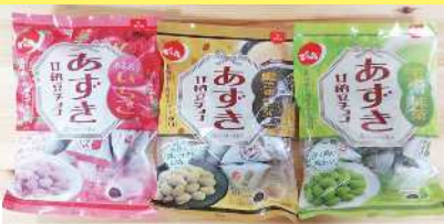
あずき甘納豆チョコ 250円 いちご あずき甘納豆チョコ 250円 黒ごまきなこ あずき甘納豆チョコ 250円 宇治抹茶