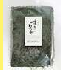
すき昆布 550円 4枚