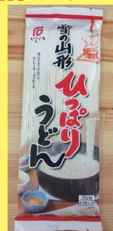
山形のひっぱりうどん 230円 250g