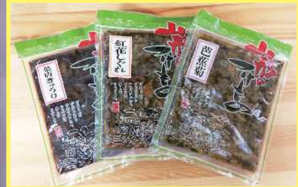
山形のつけもの 芭蕉菊 380円 130g 山形のつけもの 紅花しぐれ 380円 130g 山形のつけもの 葉唐きゅうり 380円 130g