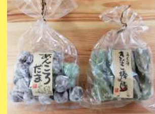
あんころだま 450円 220g うぐいすきなこ棒 450円 8本