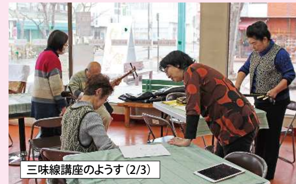
三味線講座のようす(2/3)