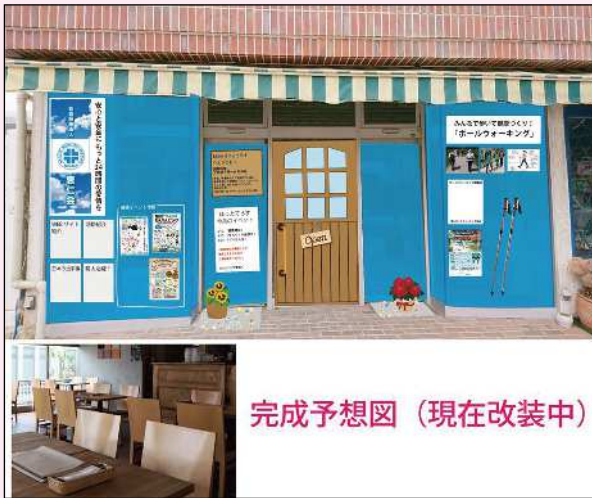
完成予想図 (現在改装中)