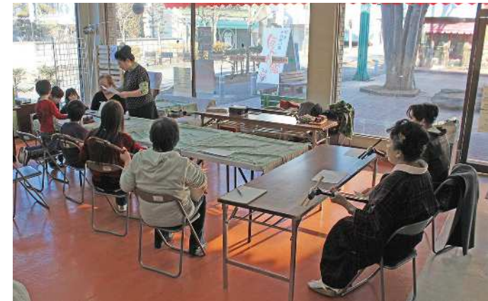
三味線講座のようす(2/17)小さな子どもさんも参加しています