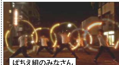
ばちえ組のみなさん