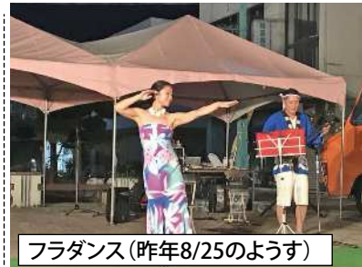
フラダンス(昨年8/25のようす)