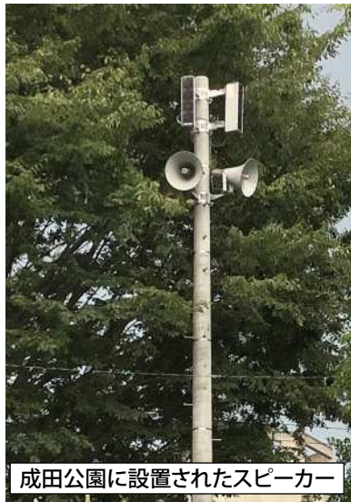
成田公園に設置されたスピーカー

昨年までは中州に2カ所、建設用の足場を設置して、スピーカーを10台以上取り付けて放送していたのですが、スピーカーケーブルを中州に渡す作業、高い足場に設置する作業などなかなか大変でした。音も良くなかったために、今年は成田公園に電柱を立て、4本のスピーカーを取り付けて、ここ1カ所だけで放送します。