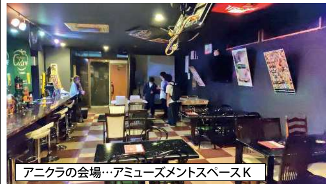
アニクラの会場…アミューズメントスペースK