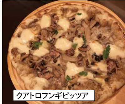
クアトロフンギピッツァ