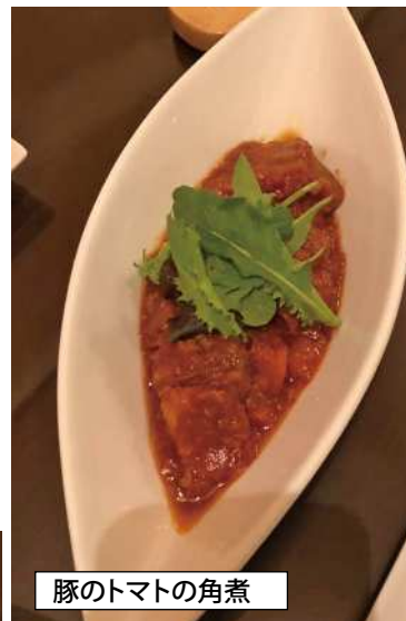
豚のトマトの角煮