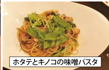
ホタテとキノコの味噌パスタ