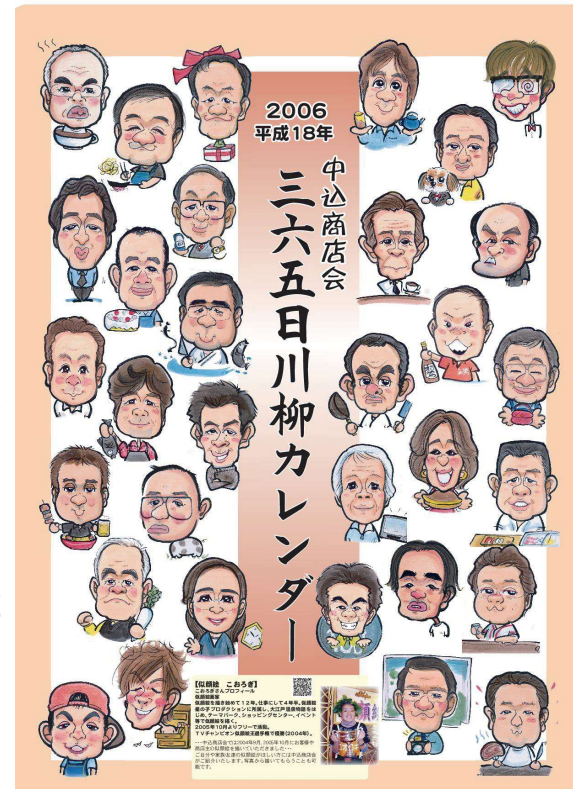
2005年12月に発行した2006年カレンダー