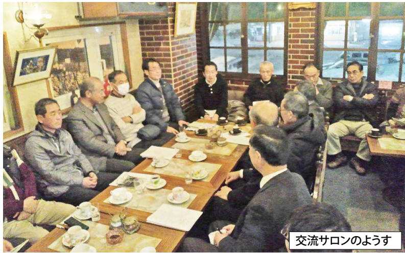
交流サロンのようす

・毎回色々なテーマを設定し、それに関心のある幅広い人々が集い交流し、話題提供者(スピーカー)を中心とした気軽に会話を楽しむ場……。 として成長して行きたいと考えています。