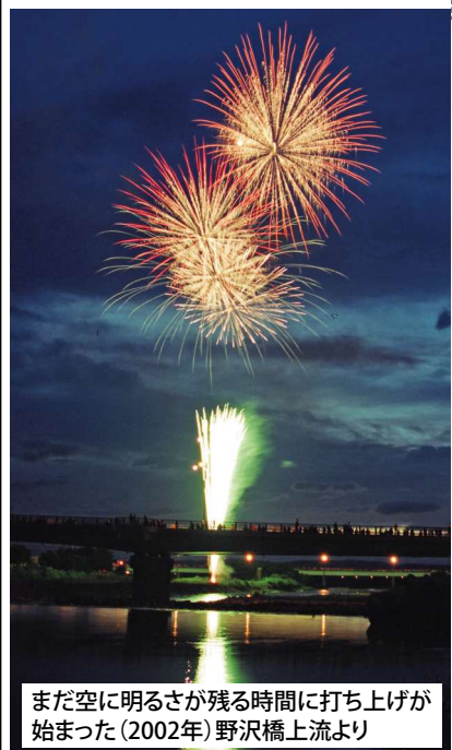
まだ空に明るさが残る時間に打ち上げが始まった(2002年)野沢橋上流より

中込商店街のイベントなど今後の予定 11月10日(金)・17日(金)オープンカフェ出店者募集 12月9日(土)クリスマスマルシェ出店者募集