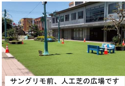
サングリモ前、人工芝の広場です